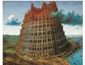
ピーテル・ブリューゲル1世 バベルの塔 Museum BVB, Rotterdam, the Netherlands

この春注目のブリューゲル代表作『バベルの塔』をはじめ、ボイマンズ美術館や所蔵作品を時代背景を交え、詳しく解説いたします。