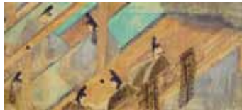
国宝 源氏物語絵巻 鈴虫二(五島美術館蔵)

4月29日(土・祝)~5月7日(日)五島美術館にて特別展示される「国宝 源氏物語絵巻 鈴虫一・二・夕霧・御法」を鑑賞し、文学と絵巻の2つの角度からみる『源氏物語』をはじめの方にも分かりやすく解説いたします。めくるめく源氏物語の世界と一緒にひもといていきましょう。講義終了後は17時まで展覧会を自由にご鑑賞いただけます。